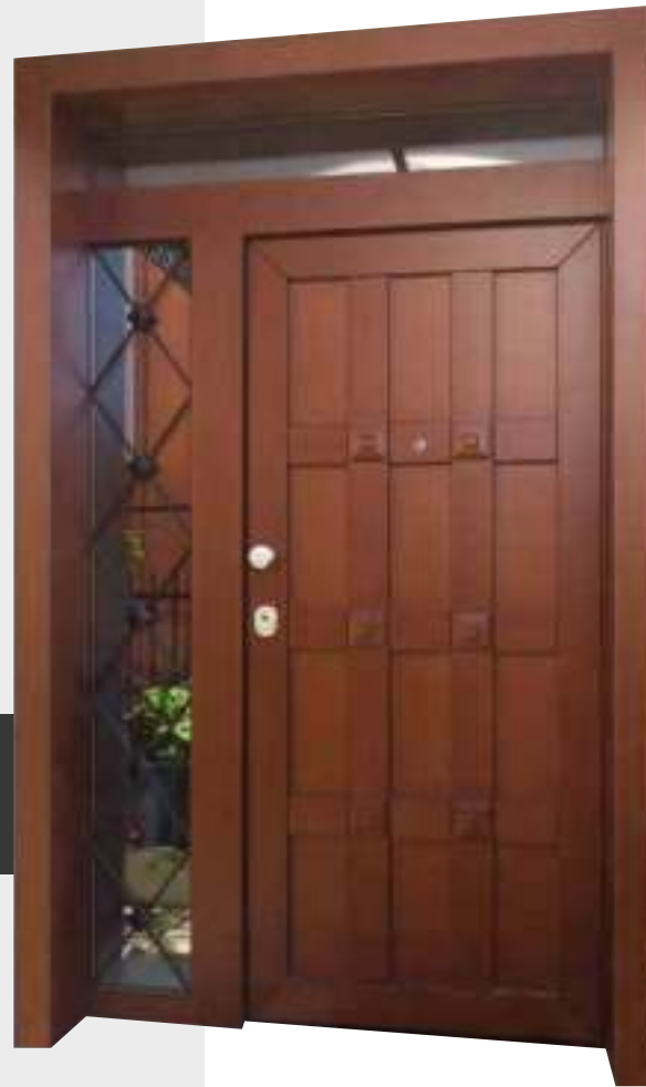
ALMA | ΠΟΡΤΑ ΕΙΣΟΔΟΥ 2