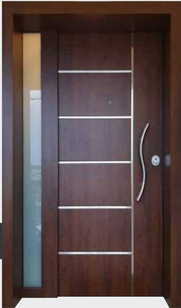
ALMA | ΠΟΡΤΑ ΕΙΣΟΔΟΥ 1